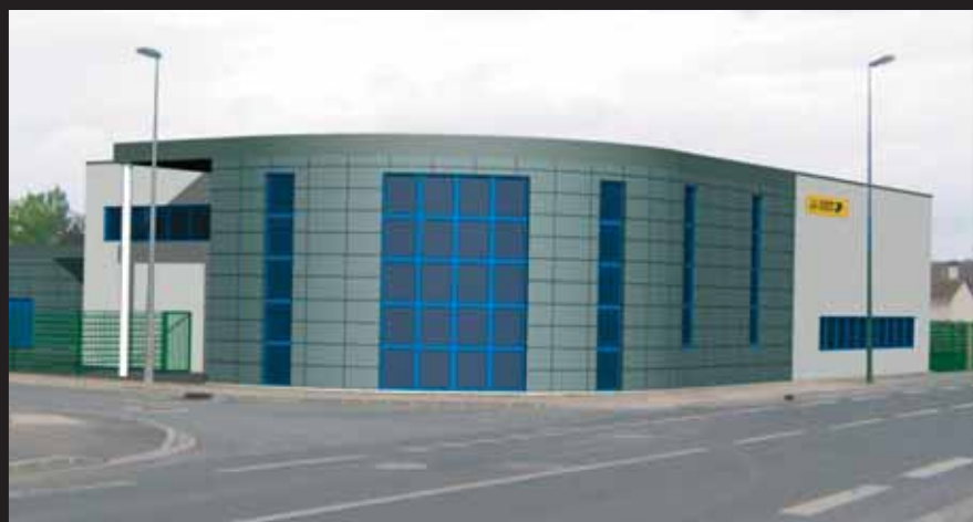
Le nouveau centre de distribution Hippodrome (quartier Croix-Rouge) entrera en service au mois de juin.