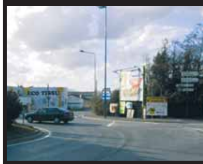
Le rond-point de la Potière, source de tracas.