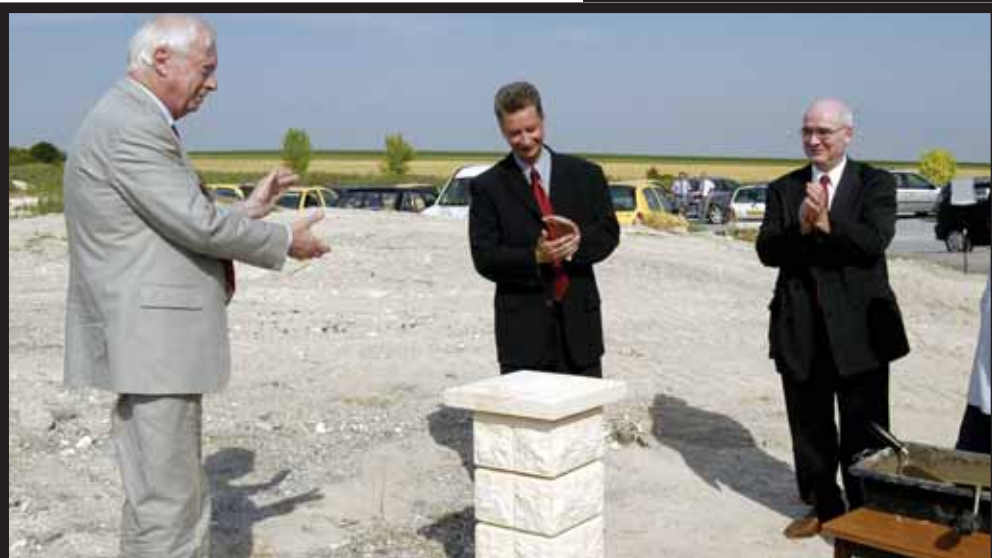
Cérémonie de pose de la première pierre à la Croix-Blandin

PARI - magazine trimestriel d'informations des parcs d'activités du bassin d'emplois de Reims. Publication : Direction de l'Economie - Ville de Reims 95 Bd du Général Leclerc - 51100 Reims tél. 03 26 77 87 50