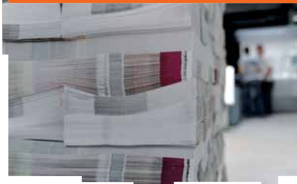
L'extension des locaux donne une bouffée d'oxygène à cette PME sparnacienne en plein développement.

Il y a une douzaine d'années, cette PME tanguait financièrement. Elle aurait pu, alors, jeter l'encre et disparaître des bords de la Marne à Épernay... Avec l'arrivée d'un nouveau capitaine et la mise en place d'un projet de relance, l'imprimerie est repartie à l'abordage. En même temps qu'elle retrouvait de la croissance, elle s'est inscrite dans une démarche environnementale qui a porté ses fruits. Mais est-ce un hasard ?