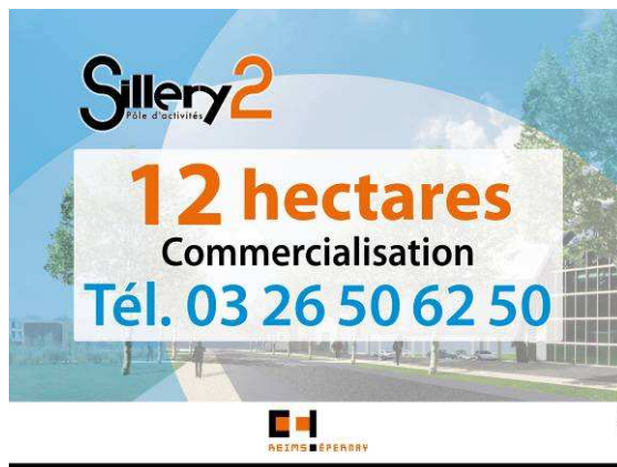
Affiches 4x3, sur la RD8 et l'A4