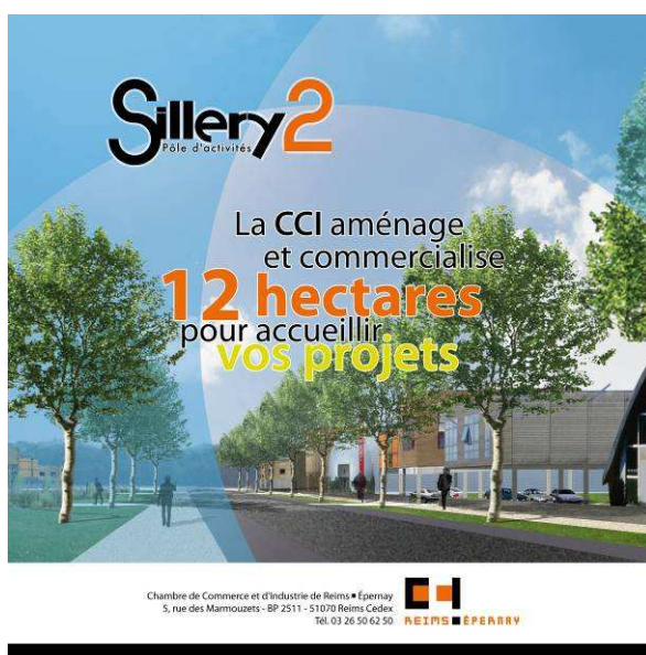
Flyer de promotion et commercialisation